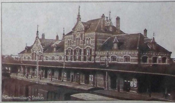
Het station van Geldermalsen.

wij durfden eigenlijk niet meer in een trein te stappen. Thuisgekomen was mijn vader woedend op mijn moeder: Hoe kon zij mij laten gaan? In die tijd werd namelijk alles beschoten wat bewoog. Mijn vader had het als machinist al meermalen meegemaakt.” Mocht u nog over aanvullende informatie beschikken, dan kunt u contact opnemen met Richard van de Velde, 0345-502583 of via zijn website www.oorlogsslachtoffers-gemeentegeldermalsen.nl .