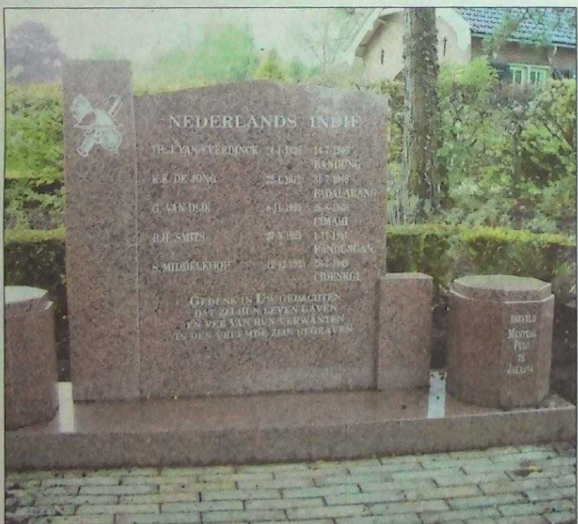
In Indië zijn ook Culemborgers omgekomen.