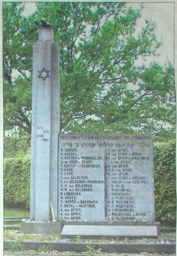
Op de begraafplaats staat ook een monument voor Joodse oorlogsslachtoffers.